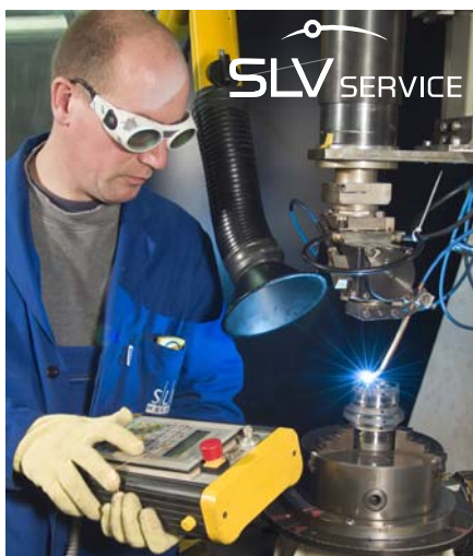
Laserstrahlschweißen von Fahrzeugkomponenten

Zum Jahresbeginn hat die SLV Service GmbH, ein Tochterunternehmen der Schweißtechnischen Lehr- und Versuchsanstalt Halle GmbH am traditionsreichen Standort Halle-Trotha, die Geschäftstätigkeit als