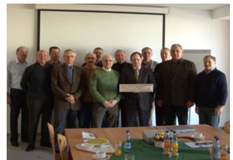
Bild 3: Teilnehmer einer Arbeitskreissitzung ehemaliger und aktiver Waggonbauer in der SLV Halle

Anlässlich der Schweißtechnischen Fachtagung am 7. November 2007 in Halle wurde der Wanderpokal durch den Vorsitzenden des DVS-BV Magdeburg, Herrn Bernd, wieder dem früheren Stiftungsinstitut übergeben. Auch eines der Wandreliefs fand seinen Weg in die Schweißtechnische Lehr- und Versuchsanstalt Halle, die Nachfolgeeinrichtung des ZIS, zurück und manch ein Schweißfachingenieur stellt unpolitisch fest, dass er auch heute stolz auf eine solche Auszeichnung wäre!