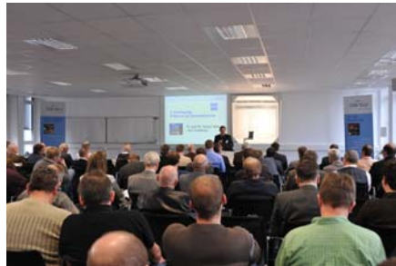
Bild 1: Teilnehmer der 2. Fachtagung „Prüfen in der Schweißtechnik“ in Duisburg

Das neue Hörsaalzentrum der SLV Duisburg bot dabei eine sehr gute Möglichkeit, die Fachvorträge, die Ausstellung sowie die Möglichkeiten zu Fachdiskussionen in direkter räumlicher Nähe zu gruppieren und somit für die Teilnehmer besonders effektiv zu gestalten.