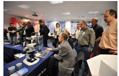
Bild 2: Firmenpräsentation während der 2. Fachtagung „Prüfen in der Schweißtechnik“ in Duisburg

Am Abend wurden die Fachgespräche in lockerer Atmosphäre fortgesetzt. Die Abendveranstaltung fand im Duisburger Zoo, einem beliebten Wahrzeichen Duisburgs, statt und wurde zur Unterhaltung der Teil-