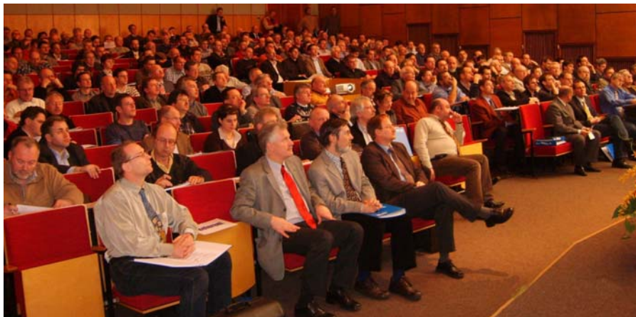
Veranstaltung zur Einführung der DIN EN 15085 in der SLV Halle GmbH

Die Anforderungen an die Schweißbetriebe einschließlich des Zertifizierungsverfahrens sind im Teil 2 der DIN EN 15085 beschrieben (also vergleichbar der DIN 6700 Teil 2). Ab April 2008 werden die Betriebsprüfungen der Herstellerzertifizierungsstellen nur noch auf Basis der DIN EN 15085 durchgeführt. Bescheinigungen nach DIN 6700-2, deren Geltungsdauer über April 2008 hinausreichen, haben Bestandschutz innerhalb Deutschlands bis maximal zum 31. Dezember 2010. Für die Instandsetzung von Schienenfahrzeugen bleibt die DIN 27201-6 auch weiterhin mit gültig.